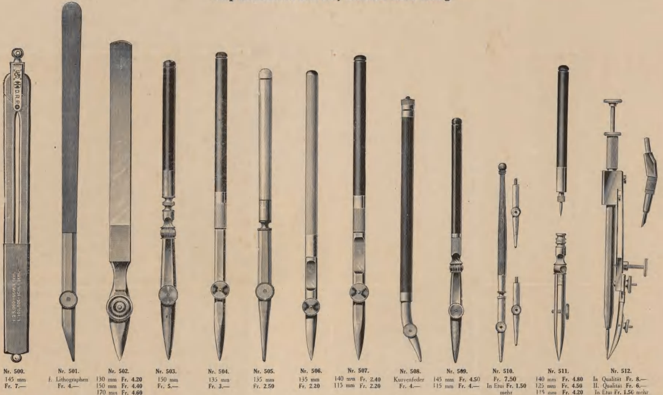
Nr. 500. 145 mm Fr. 7.— Nr. 501. f. Lithographen Fr. 4.— Nr. 502. 130 mm Fr. 4.20 150 mm Fr. 4.40 170 mm Fr. 4.60 Nr. 503. 150 mm Fr. 5.— Nr. 504. 135 mm Fr. 3.— Nr. 505. 135 mm Fr. 2.50 Nr. 506. 135 mm Fr. 2.20 Nr. 507. 140 mm Fr. 2.40 115 mm Fr. 2.20 Nr. 508. Kurvenfeder Fr. 4.— Nr. 509. 145 mm Fr. 4.50 115 mm Fr. 4.— Nr. 510. Fr. 7.50 In Etui Fr. 1.50 mehr Nr. 511. 140 mm Fr. 4.80 125 mm Fr. 4.50 115 mm Fr. 4.20 Nr. 512. Ia Qualität Fr. 8.— II. Qualität Fr. 6.— In Etui Fr. 1.50 mehr